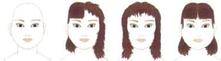
Visage en trapèze

À éviter : les cheveux courts, les mâchoires dégagées, les cheveux trop plats sur le dessus, la frange, la raie au milieu.