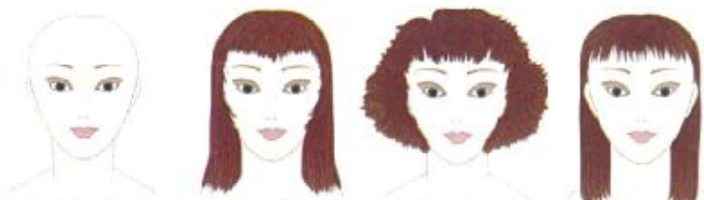
Visage en cœur

À éviter : les cheveux trop longs. Les cheveux courts si le bas du visage est trop fin.